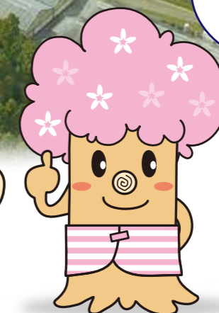
桜の木の妖精 さくらん